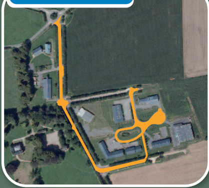
Parc Éco-Normandie : Saint-Romain-de-Colbosc