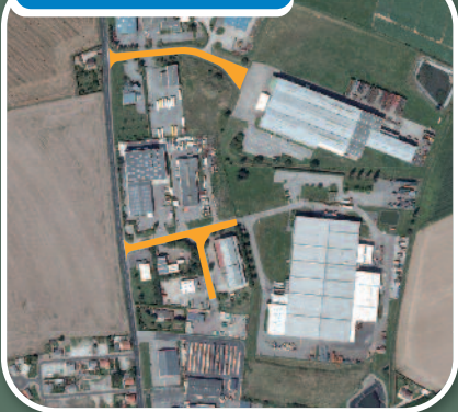
Parc de l'Aérodrome : Saint-Romain-de-Colbosc