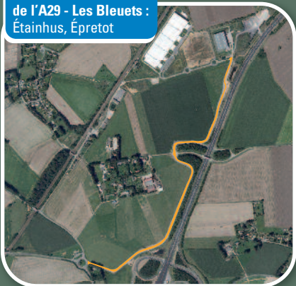
Parc d'activité de l'A29 - Les Bleuets : Étainhus, Épretot